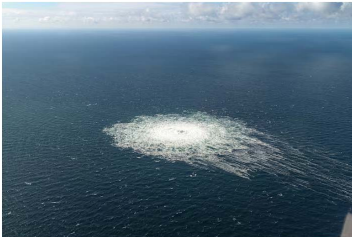
Gas leak at Nord Stream 2 as seen from the Danish F-16 interceptor on Bornholm, Denmark September 27, 2022.